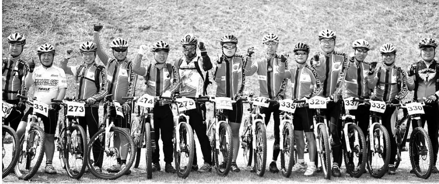
늦은 나이에 자전거를 타기 시작했지만 아름다운 풍경과 숲 내음이 주는 낭만을 즐길 줄 아는 바로콜택시MTB. (바로콜택시MTB)

대부분 회원이 50대 중반의 늦은 나이에 자전거를 타기 시작하면서 자전거 경력은 1~2년 남짓밖에 안되지만 열정만큼은