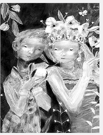
김해성 작 '봄소식'

신임 광주시립미술관장 선임을 지역 미술계의 초미의 관심사로 떠오르고 있다. 사진은 미술관 전경.