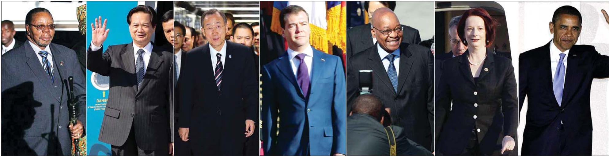
G20 서울정상회의에 초청된 각 국 정상들이 10일 인천공항과 성남공항을 통해 속속 입국하고 있다. 왼쪽부터 빈구와 무티라카 말리우 대통령, 응웬 쯤 중 베트남 총리, 반기문 UN사무총장, 드미트리 메드베데프 러시아 대통령, 제이콥 주마 남아공 대통령, 줄리아 길러드 호주 총리, 버락 오바마 미국 대통령.