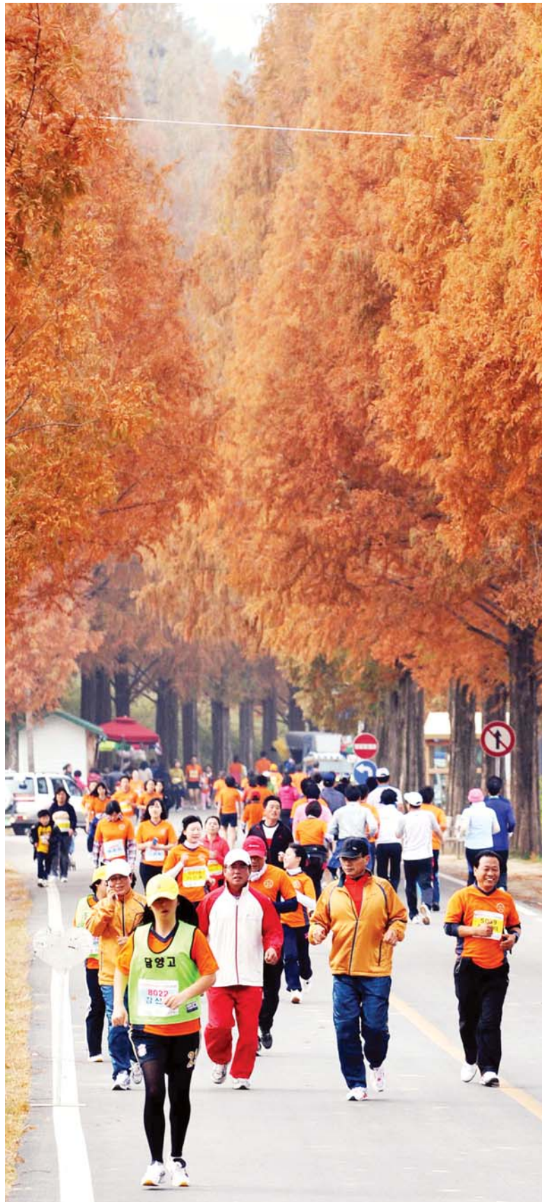
메타세쿼이아 마라톤 14일 오전 담양군 메타세쿼이아 숲에서 열린 '제8회 담양 메타세쿼이아 마라톤 대회'에 참가한 마라톤러들이 파스텔톤으로 물든 코스를 달리고 있다.