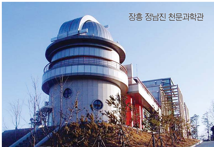
장흥 정남진 천문과학관