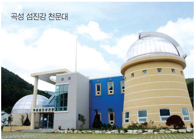
곡성 섬진강 천문대