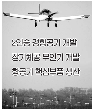
2인승 경항공기 개발 장기체공 무인기 개발 항공기 핵심부품 생산