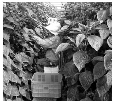
특향상 효과가 있다"고 말했다.

안씨는 "기존 경유를 사용해 난방할 경우 2억4000여만원의 난방비가 소요된 반면 지열시스템은 월 550만원 정도의 전기요금만 지출하면 됐다"며 "수확증대와 상품과를 향상 등의 효과까지 있어 연 2억원 정도의 소