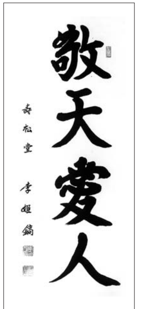
이회호 작 '경천애인'

이 밖에 김창열·김종학·이우환·임지순·오승운·천경자·김기창·허백련·채응신·허련·이하