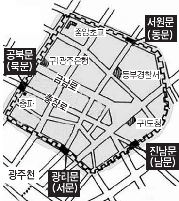
■ 세계 건축거장들의 작품이 들어설 광주음성과 4대문

각 2억원씩을 배정하기로 하고 22억원의 예산을 확보할 방침이다. 또 광주음성뿐만 아니라 푸른길 공원에도 작품 배치가 가능한 지에 대해서 이들 건축가들에게 문의한 뒤 가능하면 설치 범위를 확대하는 방안도 검토중이다.