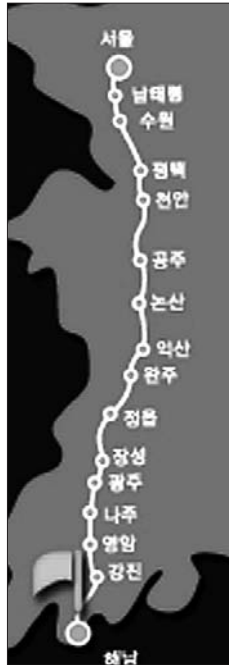
반도 동맥과 같은 역할을 했었지만 지금은 거의 잊혀진 상황이다.

이번 협약에 따라 코오롱스포츠는 해남에서 시작해 강진~영암~나주~광주~장성을 거쳐 서울에 이르는 500km 내외의 삼남길을 개척한다. 이중 전남도 구간은 약 200km. 2011년까지 걷기 관련 길을 만든다는 구상이다. 길 개척과 홍보에 소요되는 비용은 코오롱스포츠가 부담하고 전남도와 시·군은 삼남길 개척단에 원활하게 업무를 수행하기 위한 편의시설 등 행정적인 지원 및 정보를 제공