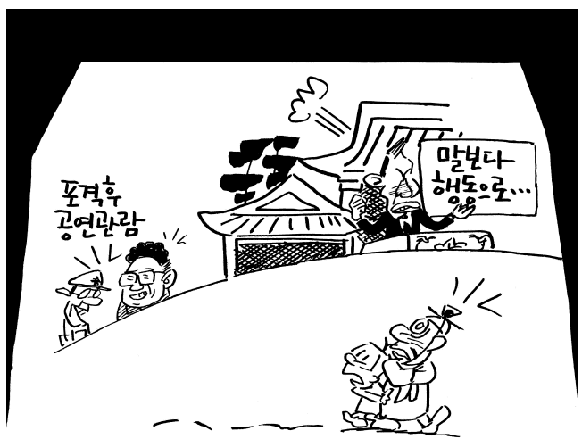
구제불능... 통제불능... 소통불능...