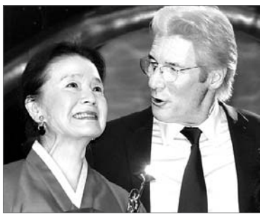
‘시’에 출연해 올해 한국제영화제에 초청받았고, 대중상과 청룡영화제에서 여우주연상을 수상했다.

영화배우 윤정희씨가 1일(한국시간) 이집트 카이로에서 열린 제34회 카이로 국제영화제에서 평생공로상을 수상했다. 윤씨는 파루크 호스니 이집트 문화장관으로부터 평생공로상을 받았으며 미국 배우 리처드 기어로로부터 축하인사를 받았다.〈사진〉 카이로 국제영화제는 지금까지 엘리자베스 테일러, 소피아 로렌, 알랭 들루 등 배우들에게 평생공로상을 수여했다. 윤씨는 이창동 감독의 영화