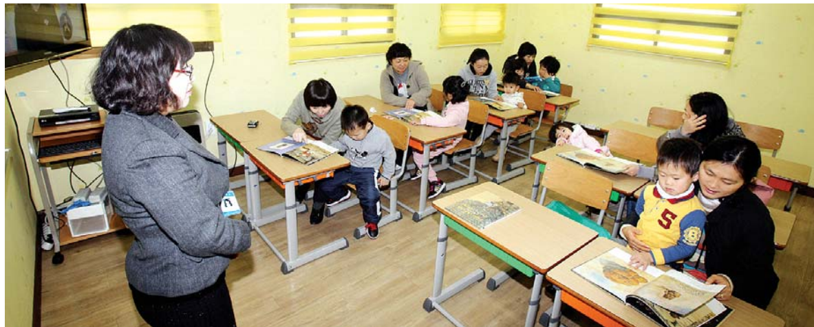
"다문화 자녀 공부방 열었어요"