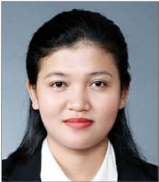
성미 한국의 품성과 문화에 빨리 적응할 수 있도록 최대한 도와주고 싶다”고 말했다. 그는 13일부터 충북 충주의 중앙경찰학교에서 6개월간 신입교육을 받고 고서경장으로 임용되며 외국인 또는 다문화가정 밀집지역에 배치될 예정이다. 광주에선 첫 결혼 이주여성 경찰관 탄생이다. /이종희기자 golee@

에 극심한 어려움을 겪었다. 하지만, 하루 8~10시간씩 한국어 공부를 해 한국에 온 지 2년2개월만에 국적을 취득했다. 그는 2008년부터 광주지역 다문화 가정지원센터에서 캄보디아 이주여성들을 위한 통역 자원봉사자로 활동했다. 특히 지난해 1월 여성가족부 산하 중앙간담가정지원센터의 다문화가정 수기공모에서 최우수상을 받기도 했으며, 현재는 광주 동강대 정보통신학과를 다니고 있다. 그는 “어릴 적부터 경찰관이 꿈이었는데, 집안의 반대로 하지 못했다.