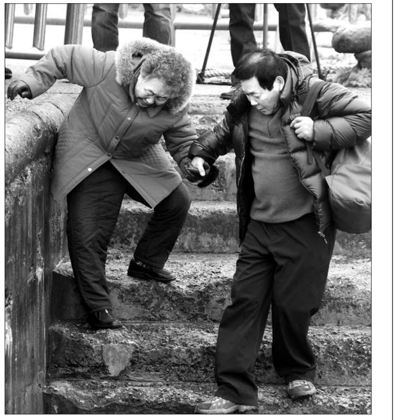
연평도 떠나는 주민들 우리 군의 연평도 일원 해상사격훈련에 북한군이 '타격'을 가하겠다고 위협한 가운데 19일 오후 연평도 선착장에서 섬을 떠나는 주민들이 배를 타기 위해 이동하고 있다.

연평도 사격훈련 재개 방침에 대해 북한군이 '자위적 타격' 운운하며 위협을 가하고 나서 우리 군의 대응 시나리오에 관심이 쏠리고 있다. 우리 군은 북한의 추가 도발에 대비해 연평도에 K-9 자주포를 추가 배치했고 다연장로켓(MLRS)과 신형 대포병레이더 등을 신규 투입했다. 또 비례성과 필요성의 원칙이 적용되는 '교전규칙'에 엄매이지 않는 자위권 차원의 응징 방침도 세워져 북한의 추가 도발이 있으면 사격원점을 향한 강력한 보복 타격이 있을 것으로 예상된다. 18일 군 당국에 따르면 우리 군은 북한군의 추가 도발에 대비해 공군 F-15K와 KF-16 전투기 기지에 비상출격 명령체제를 유지토록 하는 등 육·해·공군 합동전력을 대기시켜 놓고 있다. 군 당국은 우리 영해에서 하는 정당한 사격훈련을 발미로 북한이 또 다시 도발을 해오면 자위권 차원에서 강력히 응징할 방침이다. 북한이 방사포 등으로 연평도를 공격하면서 새로 배치된 대포병레이더인 아서(ARTHUR)로 사격원점을 찾아내 K-9 자주포와 신규 투입한 다연장로켓(MLRS)으로 타격을 가하게 된다. 북한이 지난달 23일 포격 도발 때 동원한 76mm 해안포와 122mm 방사포보다 사거리가 길고 더 위협적인 무기를 사용할 가능성도 있다. 우리 쪽의 대응사격에도 포격전이 계속되거나 북한군이 후방에 있는 사거리 60km의 240mm 방사포까지 동원하게 되면 비상출격한 F-15K와 KF-16 전투기가 도발원