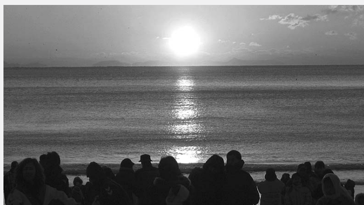
은 백사장과 소나무 숲, 다도해 경관은 어우러져 올 국토해양부 '전국 우수해수욕장'에 선정된 바 있다. /동부취재본부=주지훈기자 gju@