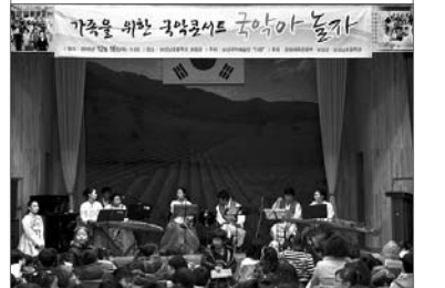
기초를 위한 국민학교 국악아 놀자