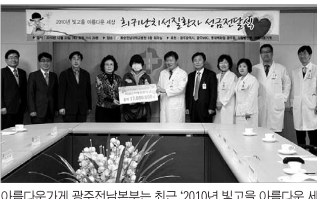
아름다운가게 광주전남본부부는 최근 '2010년 빛고을 아름다운 세상'을 통해 모은 성금 1700만원을 화순전남대학병원과 전남대병원, 기독교병원 등에 전달했다.