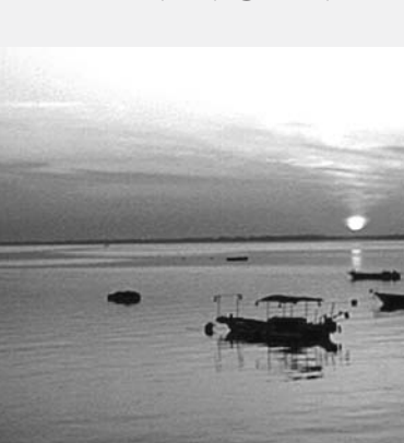
익산시 관계자는 "구제역이 전국적으로 확산됨에 따라 31일 '제6회 철새와 함께하는 울포곰 개나루 해넘이축제'와 1일 모현동 배산에서 개최예정던 '2011 배산 해맞이 축제'를 모두 취소했다.

녕과 감사! 신묘년의 희망과 변영을!'이라는 주제로 '제6회 고창 구시포 해넘이 행사'를 연다. 주요 행사로는 7080 락밴드공연과 한해의 역운을 모두 태워버리고 새 희망을 밝게 비추는 모닥불 점화, 신묘년 새해 소원을 담은 희망풍선 날리기, 통기타 라이브 공연, 불꽃 쇼 등 다채로운 프로그램으로 구성된다. 이어 새해 1월 1일 오전 6시부터는 대산면 고산과 상하면 장사산에서 해맞이 행사가 대산면 애양회와 상하면 청년회 주관으로 열린다.