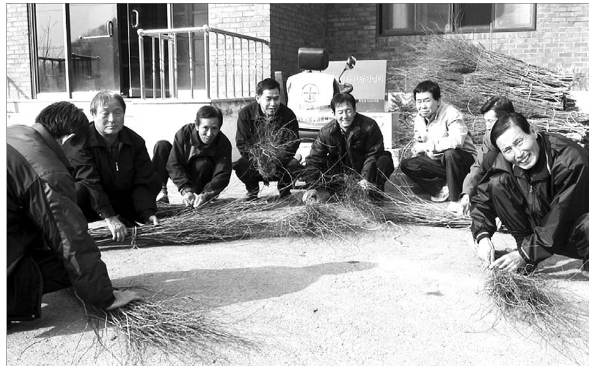
"올해 인종은 기억 싸리비로 쓸어버려요" 익산군 주천면 구암마을 노인들이 농한기를 이용해 싸리 빗자루를 만들고 있다. 노인들은 300여개를 만들어 지역 내 기관·단체에 전달했다.

익산시 관계자는 "구제역이 전국적으로 확산됨에 따라 31일 '제6회 철새와 함께하는 울포곰 개나루 해넘이축제'와 1일 모현동 배산에서 개최예정던 '2011 배산 해맞이 축제'를 모두 취소했다. /전북취재본부=박금석·류정영·조종욱기자 knews@kwangju.co.kr