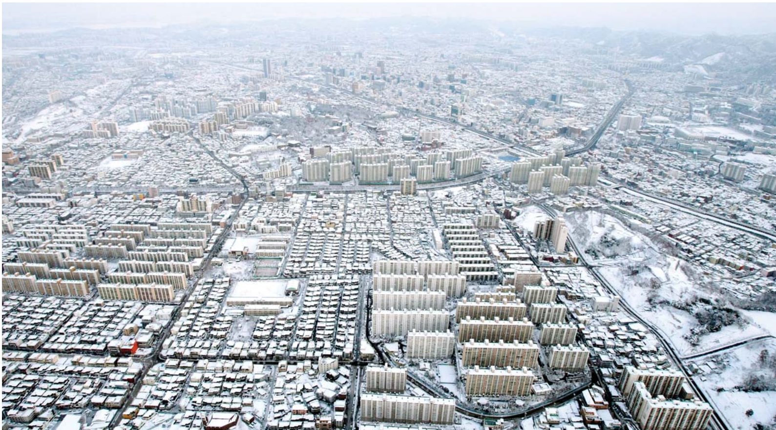
눈덮힌 광주 2일 오전 하늘에서 바라본 하안 눈속의 광주는 평화로워 보였다. 그러나 30cm에 이르는 폭설로 인해 곳곳에서 비닐하우스가 무너지고 교통사고가 잇따르는 등 시민들의 피해도 컸다. <헬기조종=광주소방항공대 소속 기장 박창순·부기장 이정곤>