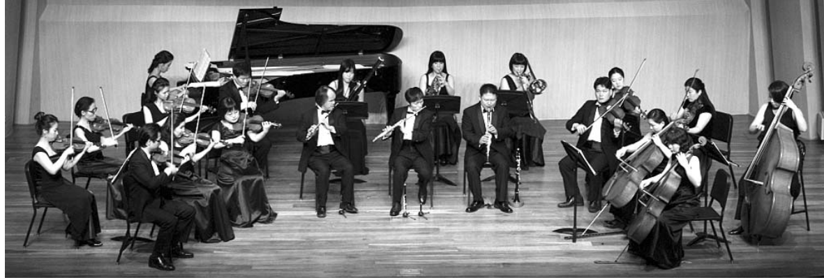
'하트 시각장애인 체임버 오케스트라'

찬바람을 녹이는 가슴 따뜻한 음악회가 시민들을 찾아온다. 눈은 보이지 않지만 마음으로 연주하는 시각장애인오케스트라와 손가락이 없지만 그 어느 연주자보다 아름다운 소리로 사람들에게 감동을 전해온 피아니스트가 함께 하는 무대다. 문화체육관광부가 복권기금 문화나눔으로 진행되는 '희망나눔 콘서트 2'가 오는 7일 오후 3시 광주감대중권 벤션센터에서 열린다. 이날 공연에는 세계 유일의 시각장