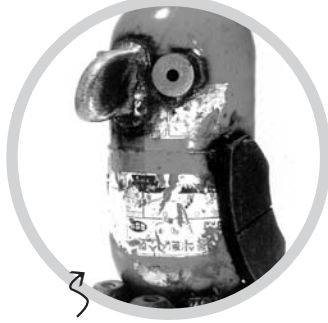
뜨거운 나라에서 온 펭귄