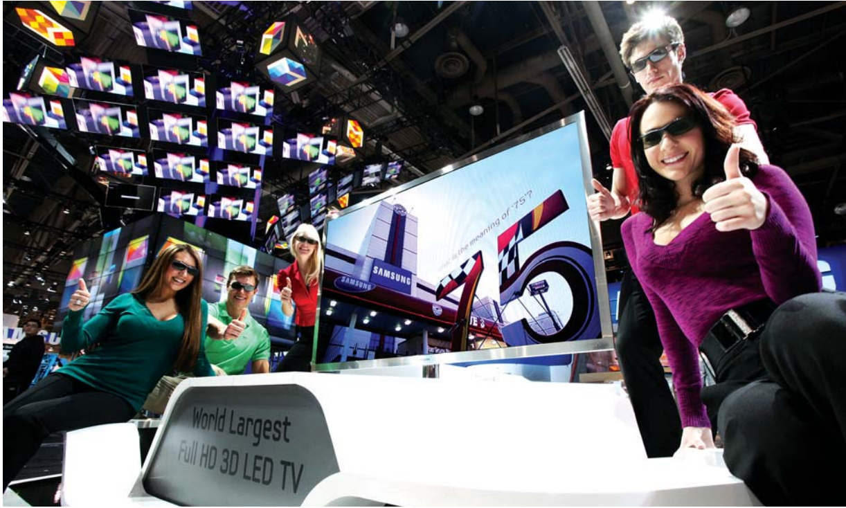
삼성전자 홍보도우미들이 9일까지 4일간 미국 라스베이거스에서 열리는 세계 최대 멀티미디어 가전 전시회인 'CES 2011'에서 75인치 스마트 TV를 소개하고 있다.