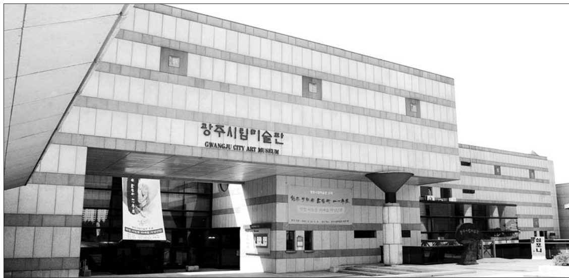
광주시립미술관이 관리하던 옛 시립미술관과 금남로분관이 민간 위탁 등을 통해 새로운 주인을 찾았다.