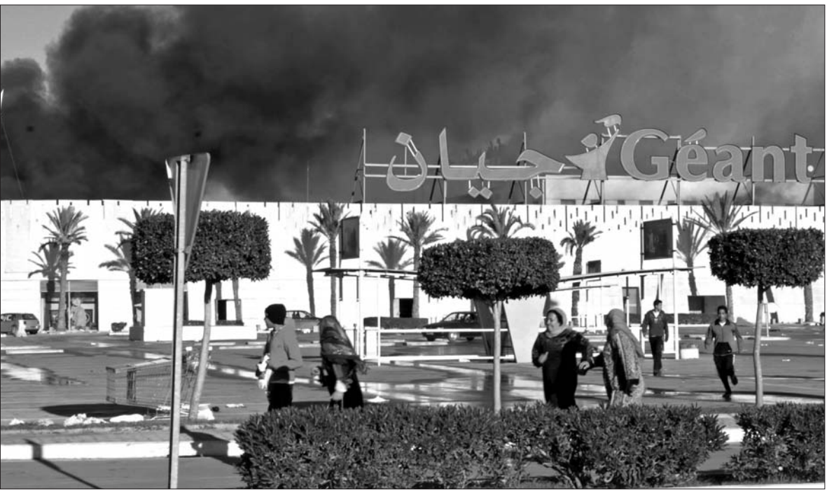
튀니지 비제르트의 한 슈퍼마켓이 15일(현지시간) 폭도들에게 약탈당한 후 불타고 있다. 튀니지에서는 벤 알리 대통령의 퇴진 시위가 벌어진 후 청사가 불타고 시내 할인매장과 상점이 약탈당하는 등 혼란이 계속되고 있다. /연합뉴스

한편 외교통상부는 16일 튀니지에 체류중인 국민들의 보호대책과 관련해 전세계를 통한 100명의 교민철수 계획을 세우고 있다"고 밝혔다. /연합뉴스