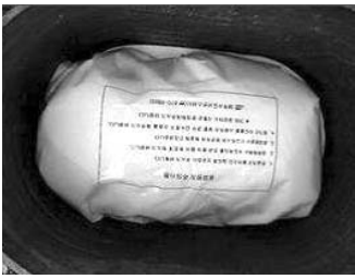
소할 수 있을 것으로 기대된다.

K-water 전남지역본부(본부장 이석천)는 민중 고유의 명절을 앞두고 이웃과 함께하는 '설맞이 사랑나눔 행사'를 펼친다.