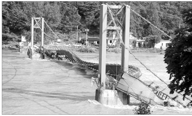
집중 호우로 유실된 현수교 모습.