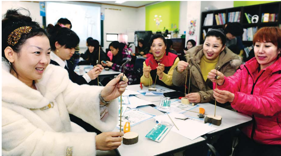
다문화 주부들 한국문화 체험 광주 북구 다문화가족지원센터의 한국문화 체험 프로그램에 참여하고 있는 다문화가족 주부들이 20일 센터 강의실에서 솜대를 만들고 있다.