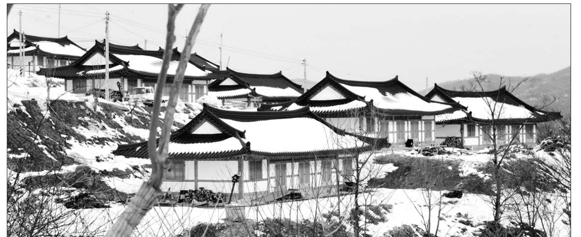
장흥군 유치면 천봉산에 위치한 신덕마을. 전남도의 행복마을 조성계획에 따라 최근 24채의 한옥이 새로 들어섰다. 인근 산책로는 슬로시티 체험 코스로 유명하고 한옥 내에 찜질방도 마련돼 관광객들의 발길을 끌고 있다.

이 순백의 겨울 숲길은 보림사 앞 5.6km 구간 내내 이어지고 걷는 동안 좁은 협곡이 동양화처럼 펼쳐진다.