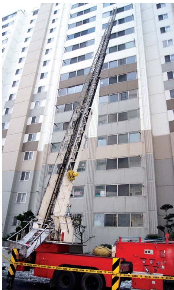
지난 22일 고층 아파트 고드름 제거작업을 하던 소방관들의 추락 사고를 부른 문제의 고가 사다리차.

장비 교체에 위해서는 시가 50%(정부 50%)의 예산을 부담해야 하기 때문에 재정 여건상 구입이 쉽지 않은 실정이다. /이종형기자 glee@kwangju.co.kr