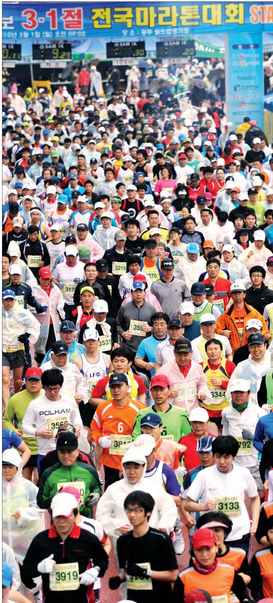
많은 이들이 참가 신청을 하면서 '제 46회 3·1절 전국 마라톤대회' 분위기가 고조되고 있다. 사진은 지난 대회 참가자들이 힘찬 출발을 하고 있는 모습.