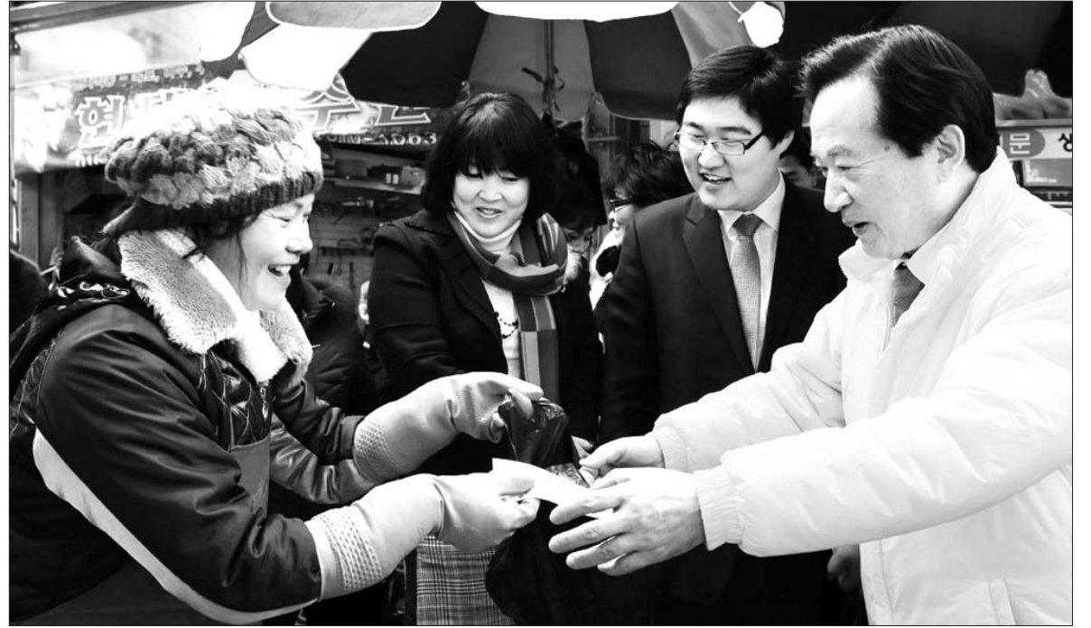
시장에 간 姜시장. 광운대 광주시장이 27일 오후 북구 말바우시장을 방문. 설 제수용품 구입하고 있다. 강 시장은 이날 상인들로부터 애로 및 건의사항을 청취했으며, 관바로 하남산단의 뉴모텍(주)을 방문, 생산현장을 둘러보고 직원들을 격려했다.