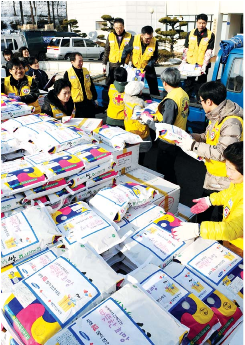
적십자 쌀·구호품 대한적십자사 광주전남지사 직원들이 27일 설을 앞두고 생활이 어려운 이웃들에게 전달할 쌀과 구호품을 배달차량에 싣고 있다.