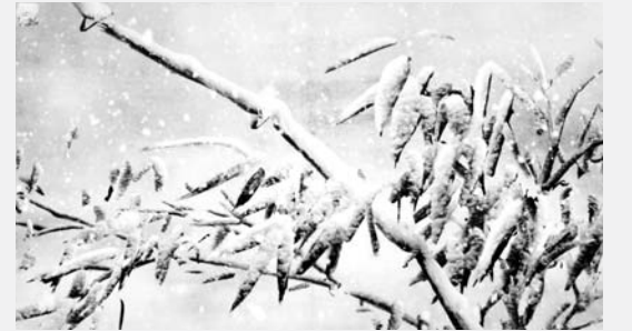
미술계의 관심을 받고 있다.