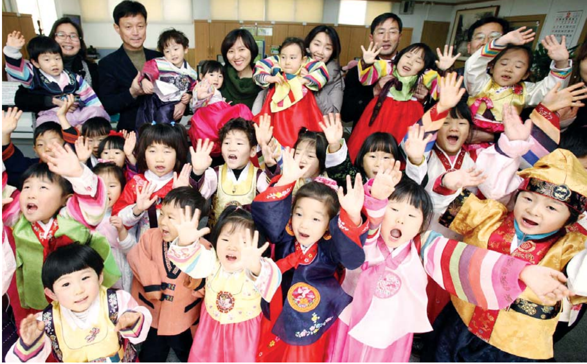
“할아버지·할머니 세배 왔어요” 설을 코앞에 둔 1일 오후 광주시 북구 중흥동 ‘꼬마박사어린이집’ 아이들이 소망경로당을 찾아 할머니·할아버지에게 세배를 마친 뒤, 즐거운 표정으로 기념촬영을 하고 있다.