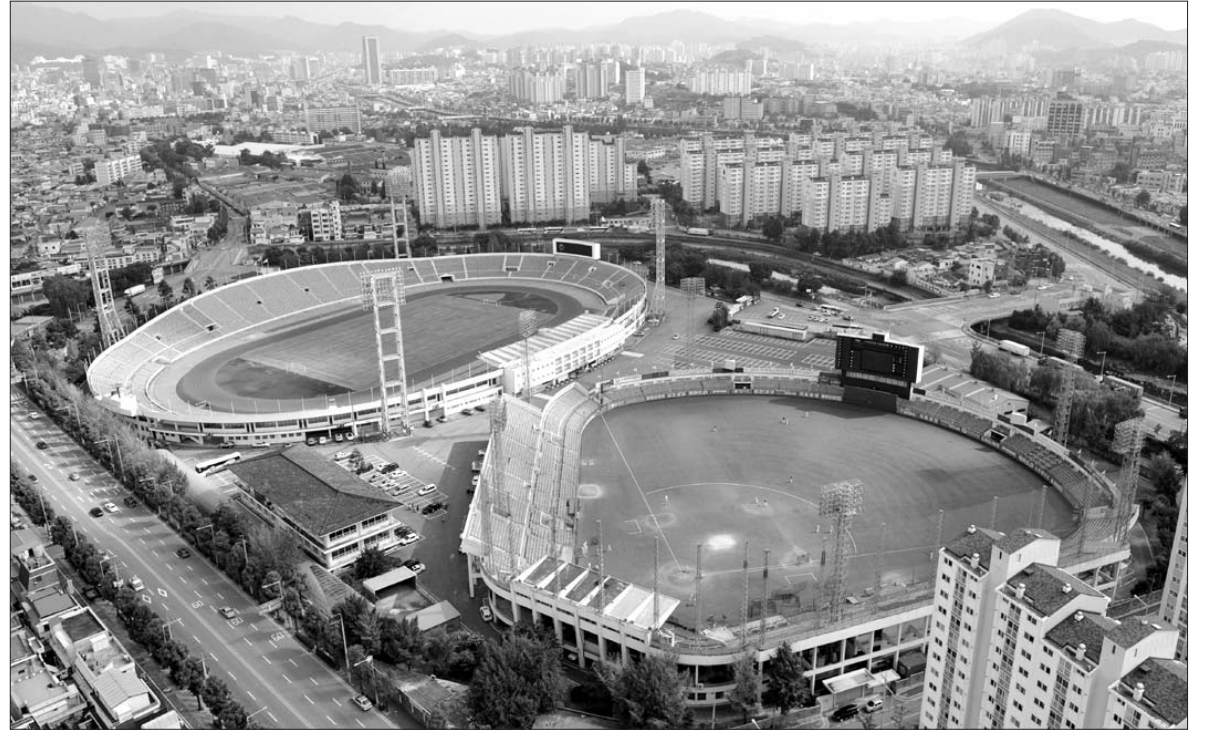
광주의 새 야구장이 들어설 무등경기장 내 축구장 철거가 이르면 올 상반기 내 진행될 것으로 보인다. 1000억원이 투입되는 이번 야구장 신공사는 설계와 시공 일괄입찰 방식으로 시공사를 선정, 오는 2013년 말 완공될 예정이다.

응시 원서는 자치단체통합 인터넷 원서접수센터(http://klid.or.kr)를 통해 인터넷으로만 접수하며 제1회 임용시험(9급 공채·연구사)은 3월 2일부터 8일까지, 2회 임용시험(9급 제한경쟁·연구사)은 4월 4일부터 8일까지, 3회 임용시험(7급 공채)은 4월 18일부터 22일까지 접수받는다. /김지용기자 dok2000@kwangju.co.kr