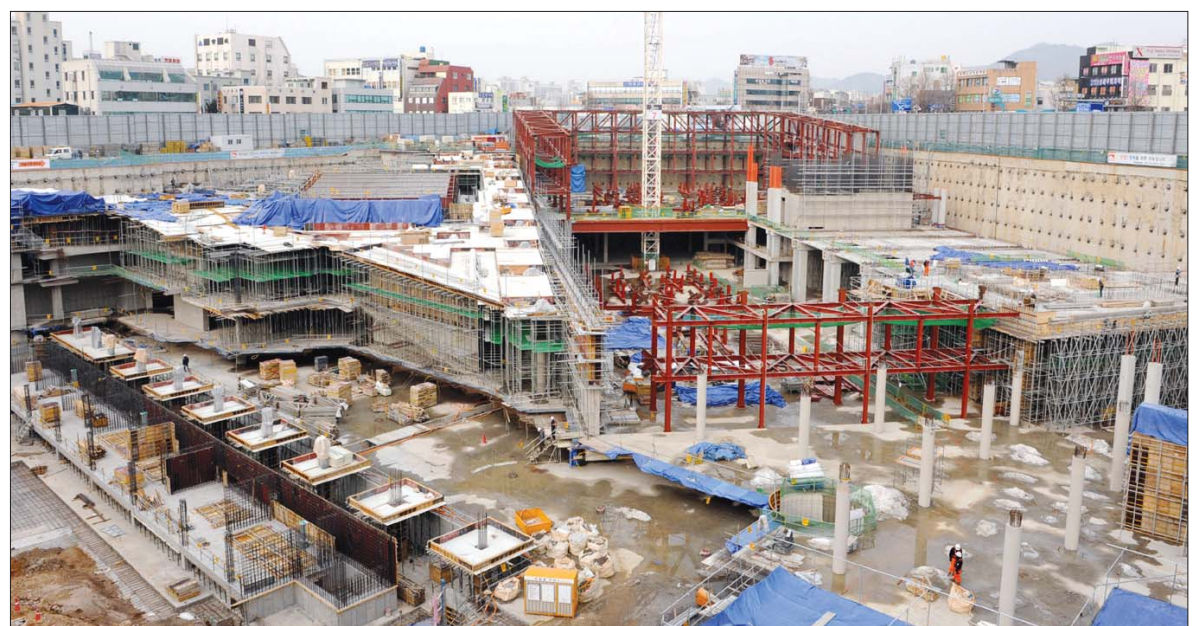
옛 도청별관 보존 논란으로 지지부진했던 문화전당 공사가 새해 들어 탄력을 받고 있다. 연내 마무리될 아시아예술극장의 골조공사가 순조롭게 진행되면서 건물의 윤곽을 드러냈다.