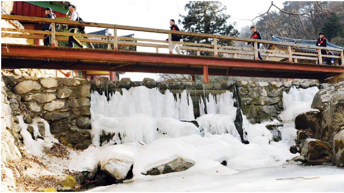
송광사의 겨울 9일 순천시 송광면 송광사 입구 다리 밑의 얼음판이 서서히 녹아내리고 있다. 기상청은 10일 광주지역 아침 최저 기온이 영하 3도까지 떨어지는 등 다시 추위가 예상된다고 전망했다.