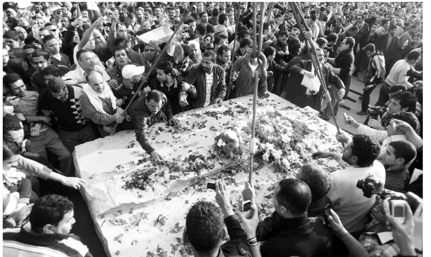
희생된 이들을 잊지 말자

30년 넘게 여당의 지위를 누려온 국민민주당(NDP)은 흑독한 체질 개선에 나서거나 체제의 길을 갈 수밖에 없을 것으로 예상된다.