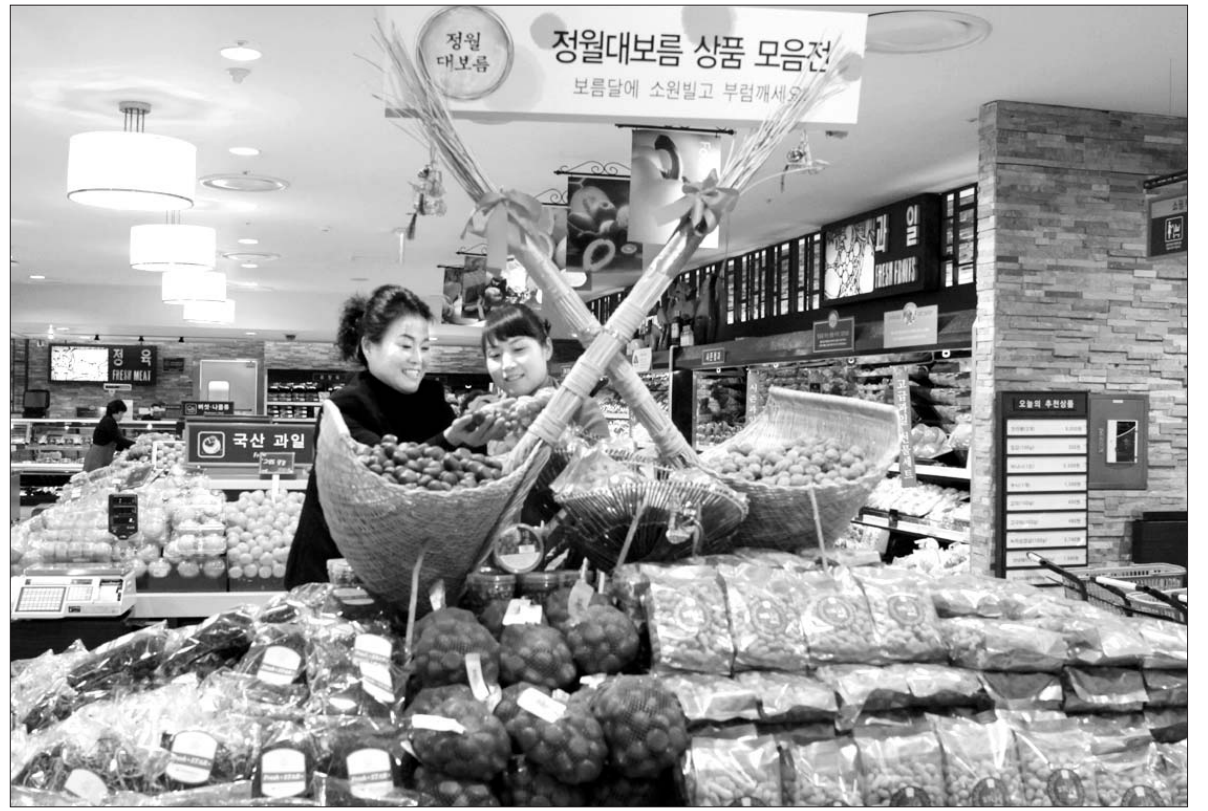
지역 백화점 정월대보름전

광주지역 백화점 3사가 정월대보름을 맞아 오는 17일까지 일제히 정월대보름 상품 기획전을 연다. 백화점 3사는 친환경 농산물을 활용한 오곡밥과 나물, 부럼·잣 등 대보름 상품을 판매한다. 사진은 광주신세계가 백화점 지하1층 특설매장에 마련한 정월대보름 상품모임전에서 고객이 밤을 들어보이고 있다.