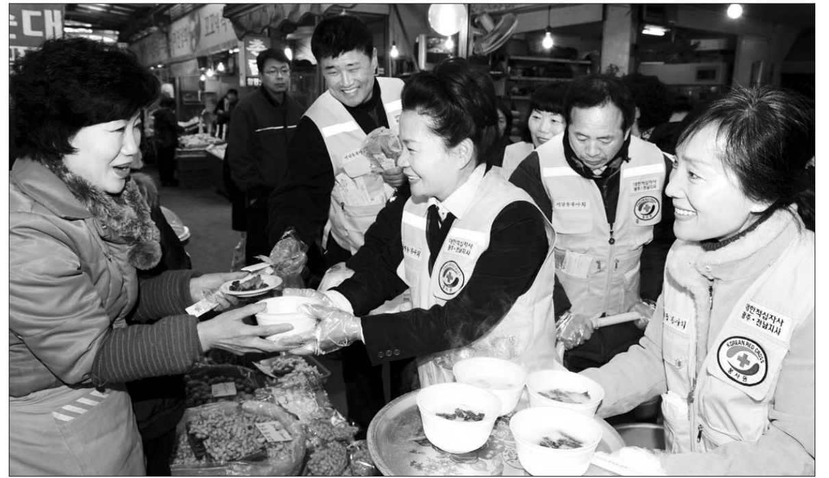
적십자사 떡국봉사 대한적십자사 광주·전남지사 직원들이 15일 남광주시장에서 시장을 찾은 시민들과 시장 상인들에게 떡국을 나눠주고 있다.