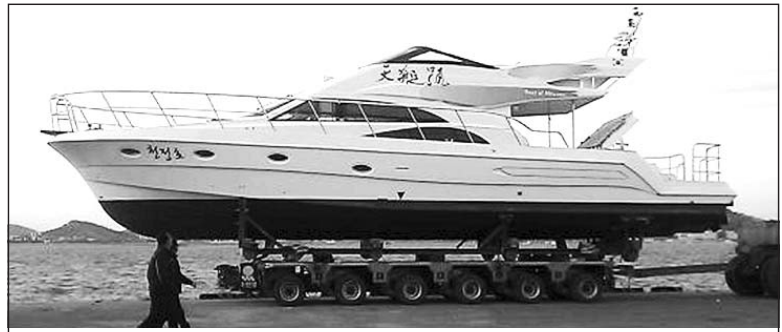
통일그룹 계열사인 ㈜일상해양산업이 오는 17일 여수에서 국내에서 최초로 전장이 15m(크루즈급)에 달하는 국산 레저보트 진수식을 갖는다.

특히 구직자가 지역, 급여, 자격 조건 등 맞춤형으로 일자리를 검색하고 원하는 기업체에 온라인 입사 지원과 알선 요청도 가능해 구직 등록에서 취업 연계까지 일괄(One-Stop) 서비스도 이뤄진다. 또한 구인업체는 채용조건과 근로 조건을 홈페이지에 등록하고 조건에 맞는 구직자를 검색하는 서비스도 이용할 수 있다. /김지윤기자 dok2000@kwangju.co.kr