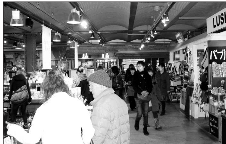
22일 요코하마 아카레나가 창고 내부의 액세서리·의류·잡화·예술작품 판매점에는 평일인데도 시민들과 관광객들로 넘쳐났다. 근대건축물이 지역 경제에도 효자노릇을 하고 있는 것이다.

아니라 이들을 어떻게 구성하고 내실있게 관리해 방문객들을 만족시킬 것인가를 늘 고민하고 있다"고 밝혔다. /윤현석기자 chadol@kwangju.co.kr