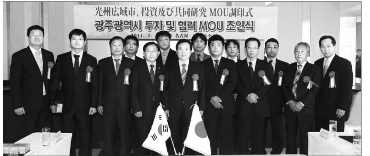
광운대 광주시장은 해외 투자유치활동 이틀째인 22일, 일본의 자동차 도시인 나고야 힐트호텔에서 투자유치설명회를 개최하고 금형기업 3개사와 연구소 2곳으로부터 모두 2250만달러의 투자를 유치했다.