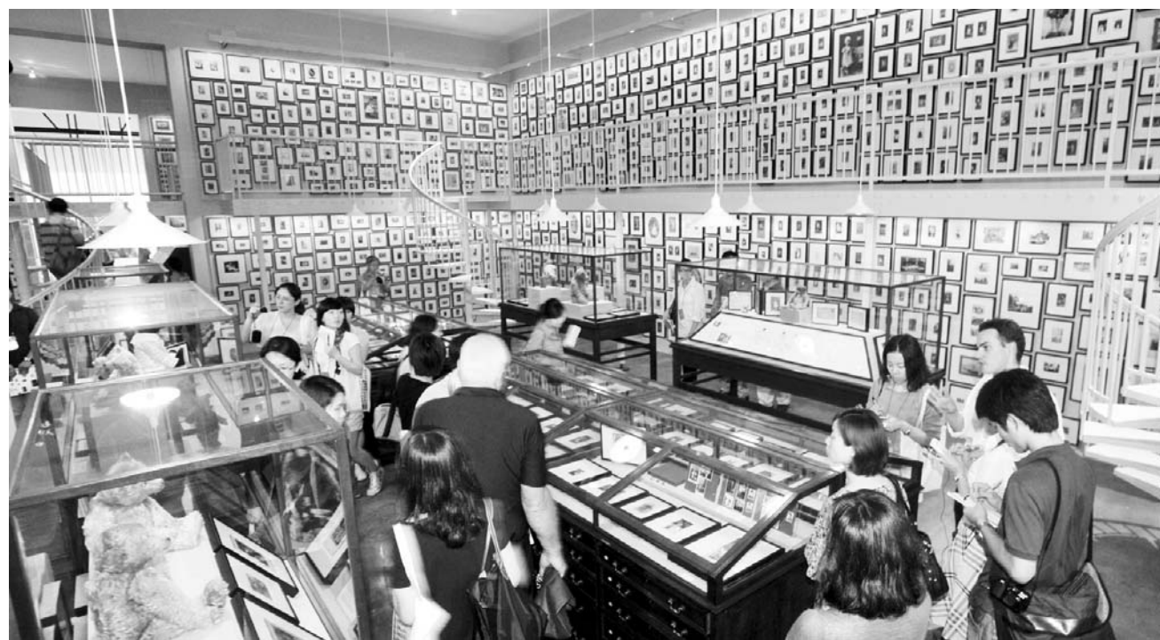
광주비엔날레는 그동안 저조했던 지역작가의 참여율을 높이기 위해 '지역작가 쿼터제' 등을 구상하고 있다. 사진은 지난해 열린 제8회 광주비엔날레 모습.

지역 작가들이 역차별을 받는다'는 비난이 쏟아지기도 했다. 지난해 열린 제8회 광주비엔날레에는 3명의 지역작가와 4명의 작가가 참여한 1개의 프로젝트팀이 참여했다. 또 제5회 11명을 제외하면, 대부분 1~5명의 지역작가들이 본 전시에서 초대됐다. 1~8회 대회의 총 참여작가 896명 중 지역작가는 대략 4%인 36명이다. 광주와는 달리, 자국·주최도시 작가 쿼터제를 시행하고 있는 다른 비엔날레들도 많다. 상하이비엔날레는 전체 참여 작가의 절반 이상을 자국 작가로 채우고 있다. 반면, 감독의 성향과 기획 의도에 맞는 작가와 작품을 선정하는 비엔날레의 특성상 강제적으로 지역 작가를 할당할 수 없다는 의견도 거세다. 무리하게 지역 작가들을 끼워넣다 보면, 전시의 전체적인 질에 영향을 미칠 수 있다. 전시의 주제와 분위기를 고려하지 않고 출생 지역에 따라 작가를 전시에 초대되는 것 자체가 예술 행사에도 맞지 않기 때문이다. 재단 관계자는 "지역 참가 참여를 늘리는 문제는 그동안 '뜨거운 감자'였지만, 이번 광주비엔날레의 예술적 성공을 지역 미술계 발전으로 연계시키기 위해 '지역작가 쿼터제'를 연구하고 있다"고 설명했다. 레지던스 프로그램도 지역 작가 육성을 위해 재단이 꺼내든 돈보이는 카드다. 그동안 축적된 재단의 예술적 역량과 국제 네트워크를 활용해 적극적으로 지역 작가의 성장을 돕는 방안이다. 용봉동 비엔날레 전시관 옆 용봉계 부지 위에 오는 3월 들어서는 재단 사무공간과 홍보관이 완공되면, 현 사무공간을 리모델링해 레지던스 공간으로 활용할 계획이다. 재단 관계자는 "감독의 성향에 따라 지역작가 쿼터제의 성사 가능성이 달라질 수 있어, 감독 계약 당시 지역 쿼터제를 명시하거나 사전에 조율하는 방안이 논의 중"이라고 말했다.