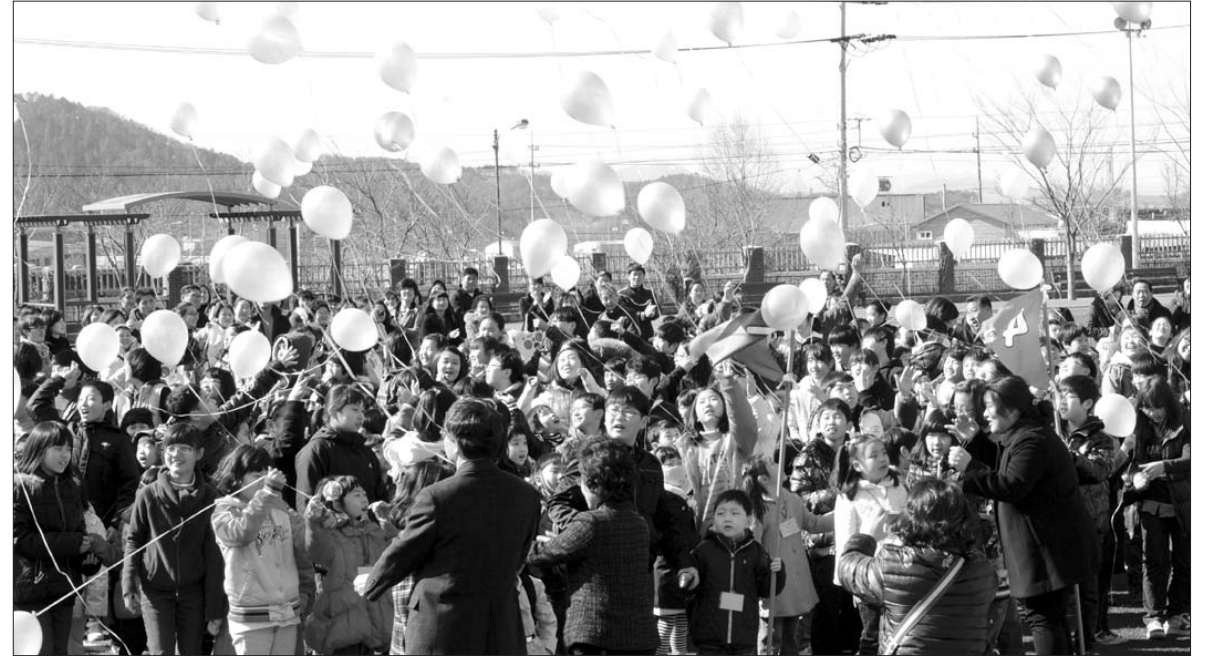
'희망 풍선' 두등실 2일 오전 열린 화순 제일초등학교 입학식에서 6학년생과 1학년 신입생들이 힘찬 출발을 기원하는 '희망의 풍선날리기' 행사를 갖고 있다.