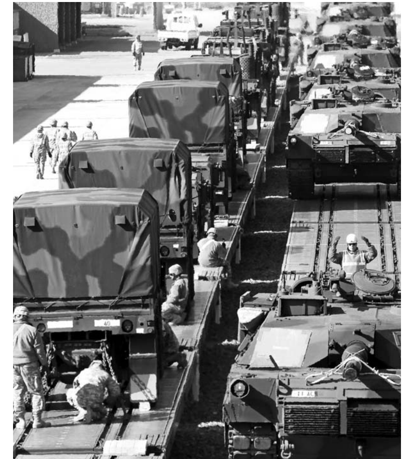
‘키 리졸브’ 사전배치물자 철로 수송 3일 ‘키 리졸브’ 훈련이 진행중인 경북 철곡군 왜관을 캠프캐슬에서 미군 병사들이 M1A1 탱크 등 사전배치물자를 전방으로 수송하기 위해 열차에 싣고 있다.