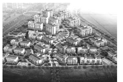
자세한 내용은 LH 콜센터(1600-7100)로 문의하면 된다.

신청 접수는 오는 29일부터 30일까지 LH 광주전남본부에서 받으며, 당첨자 발표는 다음달 8일, 계약 체결은 다음달 27일부터 29일까지다.