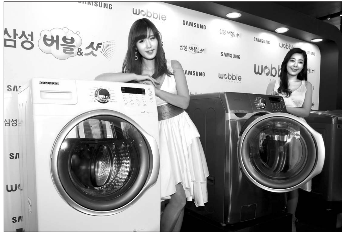
2011년형 삼성 드럼세탁기

설비건설협회 광주·전남도회 관계자는 “전반적인 건설경기 불황에도 불구하고 광주·전남 기계설비분야는 22%라는 괄목할만한 성장을 이뤘다”며 “이는 회원사들의 타지역 하도급 물량이 늘어난 데다, 해외 플랜트 시장 진출이 활발해졌기 때문이다”고 말했다. 한편, 설비건설협회 광주·전남도회는 24일 오전 11시 광주시 남구 프라도관광호텔에서 회원사 대표와 유관기관 관계자들이 참석한 가운데 ‘2011년 정기총회’를 개최한다. /박정욱기자 jwpark@kwangju.co.kr