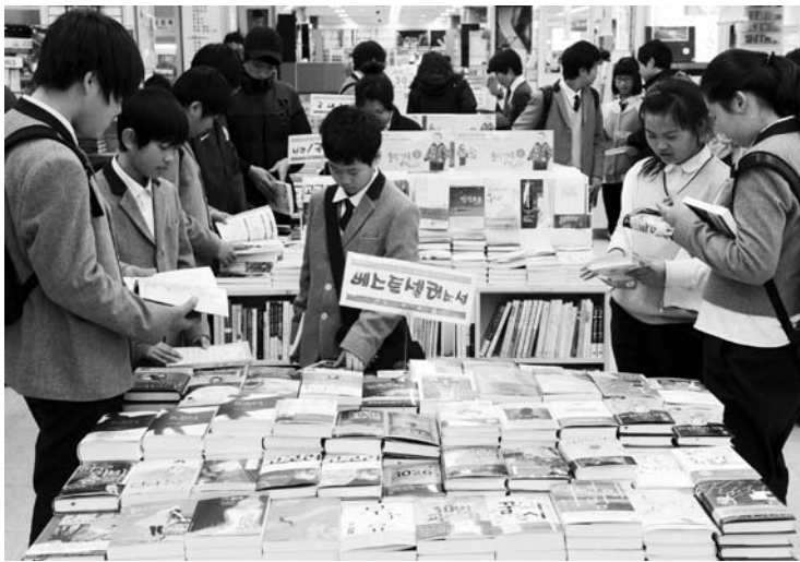
24일 서점체험열차 프로그램에 참여한 나산중학교 학생들이 층장서림 진열대에서 책을 고르고 있다.

손님은 함평학다리중앙초등학교와 나산중학교 학생 200여명이 됐다. 24일 오전 무공화호 열차로 함평을 출발한 체험단은 광주송정역에서 지하철도를 타고 광주 층장서림에 도착 서점체험을 했다. 이들은 점심식사 후 도심체험 등 자유시간을 갖고 오후 3시 34분 무공화호 열차로 귀가했다. 주최측은 25일에도 학교중앙초등학교 학생을 대상으로 같은 일정의 체험행사를 가질 예정이다. 이번 프로그램에는 최근 청소년 시집 '그래도 팬잖아'(푸른책들 펴