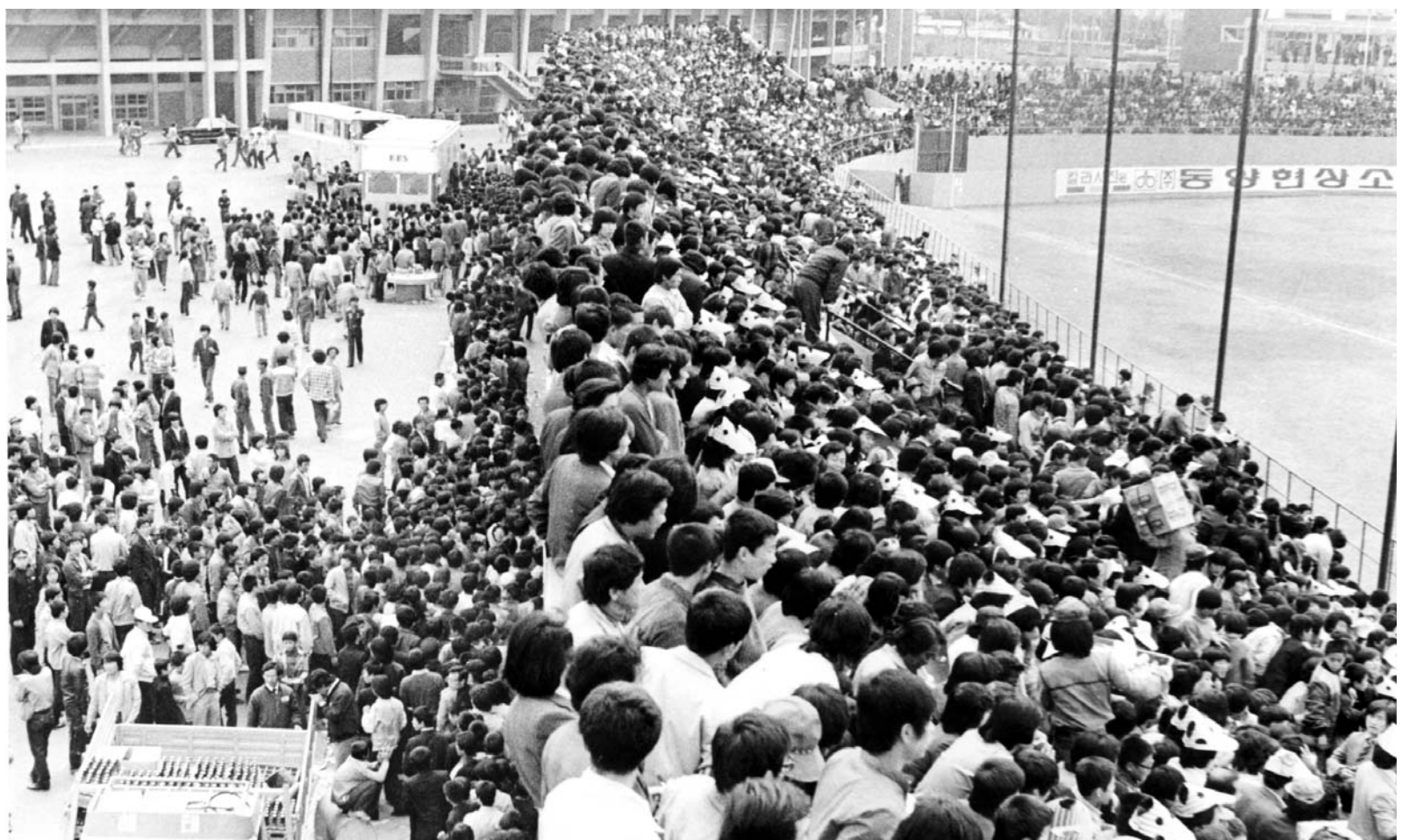
1982년 3월31일 2만여 인파가 찾은 해태와 MBC의 홈개막전을 시작으로 무등골의 프로야구 역사가 시작됐다. 2010년 592만8626명의 관중을 유치하며 29시 만에 1억 관중을 돌파한 프로야구는 30돌을 맞는 올 시즌 사상 첫 600만 관중에 도전한다.