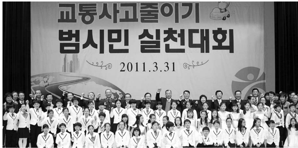
“교통사고 줄입니다” (사)광주선진교통문화 범시민운동본부 소속 회원들이 지난 31일 서구 치평동 광주 시청 대회의실에서 교통사고 줄이기 범시민 실천대회를 연 뒤 범시민 참여와 실천 의지를 다지며 환호하고 있다. 이날 행사에는 녹색어머니회·손해보험협회·학생·공무원 등 시민과 각계인사 900명이 참석했다.

형 건물로 현재 지붕과 창호공사가 진행 중이며 올해 6월 말이면 준공된다. 도서관에는 장서실과 종합자료실, 어린이자료실, 디지털 자료실, 영상자료실이 들어서며 지역 주민 휴게공간 역할을 할 수 있도록 갤러리와 세미나실 등도 갖추 계획이다. 전남도는 6월 말 도서관을 개관하기로 하고 기본장서 확보와 디지털도서관 구축, 가구 및 기자재 구입 등에 따른 세부 절차를 진행 중이다. /김지을기자 dok2000@kwangju.co.kr