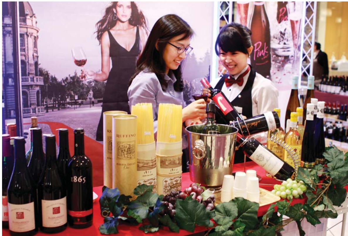
봄을 부르는 로맨틱 와인

광주신세계 지하1층 신세계 L&B매장에서는 봄을 부르는 사랑고백와인 스위트 와인부터 봄나들이갈때 샌드위치와 김밥 등에 어울리는 로제와인, 샴페인, 파파야의 열대과일향이 강한 칠레와인까지 다양한 봄을 부르는 와인 시음회를 열어 고객들의 눈길을 끌고 있다.