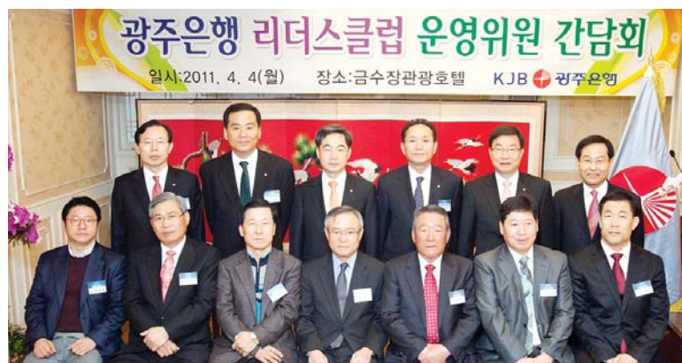
광주은행 리더스클럽 운영위원회 간담회

광주은행은 4일 오전 계림동 금수장호텔에서 우수 중소기업고객 모임인 광주은행 리더스클럽 회장단을 초청 '2011년 광주은행 리더스클럽 중앙회 회장단 선임 및 운영위원 간담회'를 가졌다.