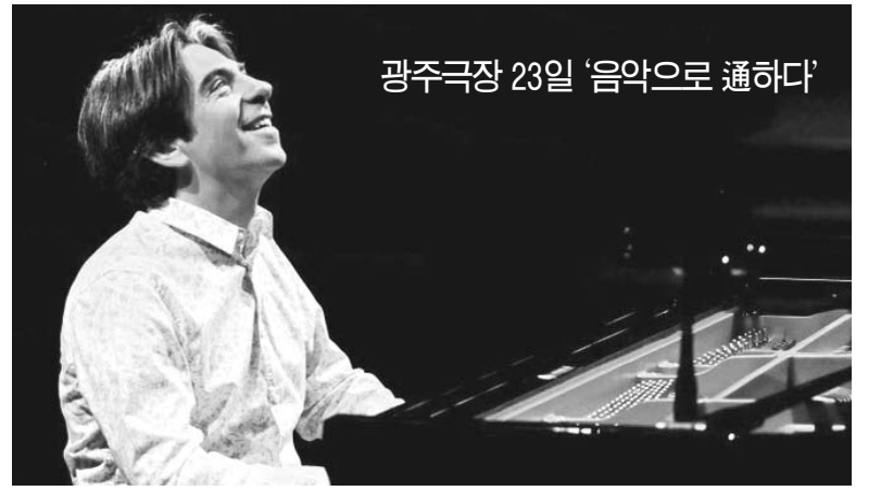
광주극장 23일 '음악으로 통하다'