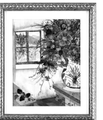
립, 페튜니아 등 꽃꽂이와 매발톱꽃, 앵초 등 야생화 100종과 야생화 상품 전시판매가 이뤄지고 토속 먹거리장터도 운영돼 압화예술 감상과 함께 구례의 맛을 느낄 수 있다. /동부취재본부=이진희기자 ik5826@

국내작품은 최고상인 대통령상에 하근영의 ‘피우오리다’를 비롯해 풍경 대상 2점, 디자인 대상 1점, 응용 대상 1점 등 부문별 대상 4점, 최우수 10점, 우수 40점, 입선 171점이 전시된다. 국제작품에서는 최고상인 대상에 일본의 나카야마 오토코의 ‘마음에 드는 방(사진)’과 입체작품 등이 선보인다. 또 압화전시관 일원에서는 틀