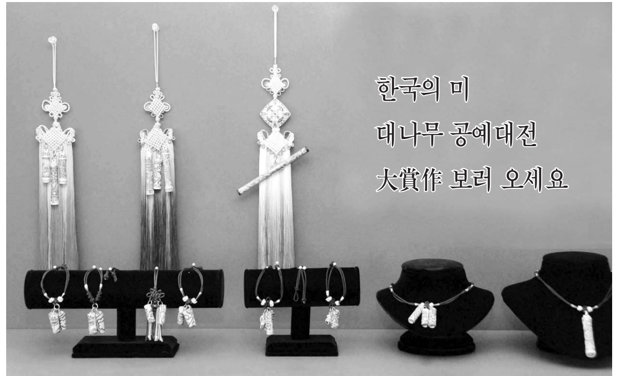
한국의 미 대나무 공예대전 대작품 보러 오세요

그러나 공중보건의 감소가 올해에만 그치지 않고 앞으로 지속적으로 진행될 것으로 보여 나도와 오지가 타 지역에 비해 상대적으로 많은 전남지역 주민들의 피해 발생이 우려된다. 배양자 전남도 보건복지여성국장은 "의료취약지역이 많은 전남에서는 공중보건의 역할을 할 수 밖에 없다"며 "다른 지역도 공중보건의에 대한 의존도가 높아 신규인력을 추가 배치 받기가 쉽지 않다"고 말했다. /장필수기자 bungy@kwangju.co.kr